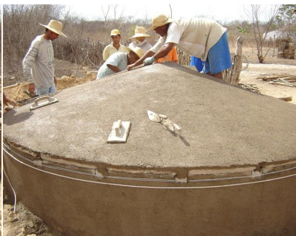
Traço: 5 latas de areia para 1 de cimento