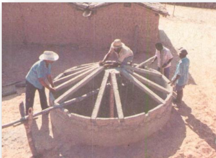
Colocação das placas do teto