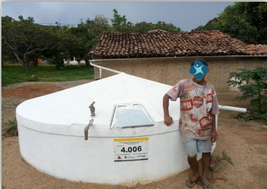
Foto 1: Visualização da tampa, bomba manual, placa de identificação e do beneficiário

Além disso, os técnicos de campo deverão realizar pelo menos um registro fotográfico do beneficiário junto à tecnologia, em tomada que apresente a placa de identificação com o número da cisterna, a tampa, a bomba manual, o sistema de descarte da primeira água da chuva e as calhas de ligação da cisterna à casa do beneficiário, anexando-o ao Termo de Recebimento.